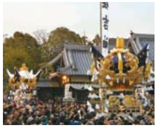
北条節句祭り ※毎年、4月第1土日に開催

周辺には公園やお寺・古墳なども点在。 少し足をのびて歴史浪漫に ひたってみませんか。