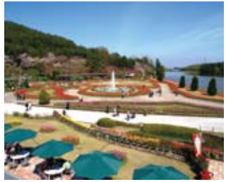
兵庫県立フラワーセンター

播磨三大まつりの一つに数えられる伝統の祭りで、13台の豪華な屋台が街中での巡行と勇壮な宮入を行い古式ゆかしい鶏合せ神事や龍王の舞などが奉納されます。