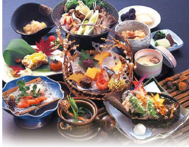
会席料理 (イメージ)