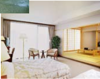
別館和洋室 バリアフリールーム

ゆったりと開放的な大浴場には手摺りなどを設置し、ご高齢の方にも安心して入浴をお楽しみいただけます。客室は全室バス・トイレ付で、トイレはウォシュレットタイプ。種類も和室、洋室、和洋室そしてバリアフリールームと多彩。お好きなタイプをお選び頂けます。