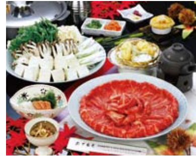
鍋会席料理 (イメージ)